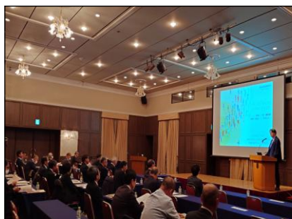
春季労使交渉研究会（2月）