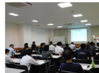
人事労務基礎セミナー