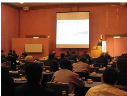
春季労使交渉研究会（2月）