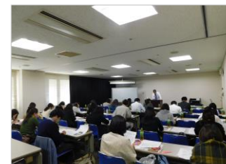
年末調整実務セミナー

会報誌発行（ホームページからも閲覧できます）・各種主催セミナー・講演会等のご案内、労働行政・労働統計など雇用労働分野の最新ニュース、国・経団連・岡山県・岡山労働局の施策・動向等の最新情報など