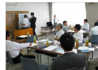
管理監督者向けセミナー