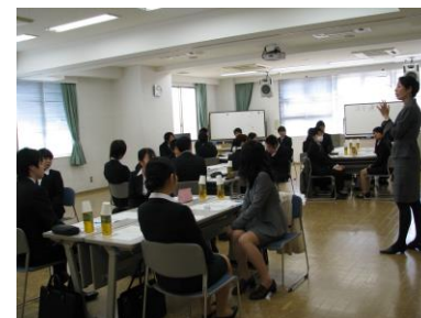
ビジネスマナーセミナー

経営講演会／優良企業視察／春季労使交渉研究会／人事賃金研究会／ビジネスマナーセミナー／社会保険・労働保険セミナー／管理監督者教育セミナー／年末調整実務セミナー／人事賃金セミナー／人材育成セミナー／通信教育斡旋・・・等