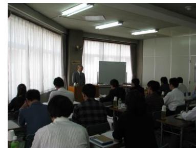
管理監督者教育セミナー